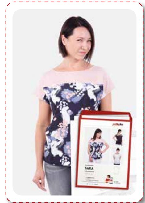
Pattydoo Damenshirt Sara

Bei Anmeldung erhalten Sie eine Materialliste für diesen Kurs.